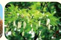
クマシデの若い果穂