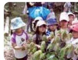
赤ちゃんの葉っぱ やわらかいね