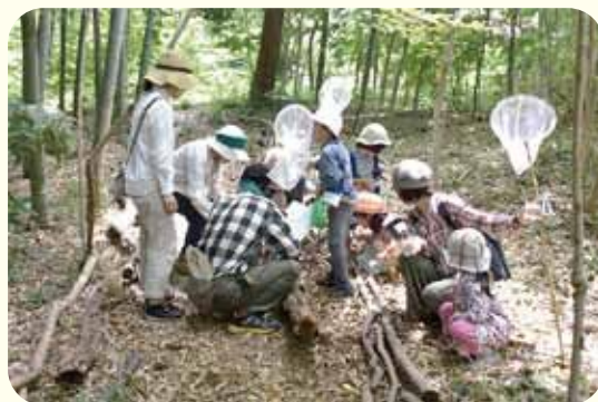
夏休みに実施した「虫とあそぼう！」

森のベンチに座っていると、キツツキが木をつつく音や小鳥の声が聞こえ、木々の緑に癒されます。どうぞお散歩においでください。