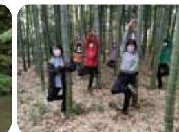
あおぞらヨガ教室!?