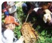
木を食べる虫かな？