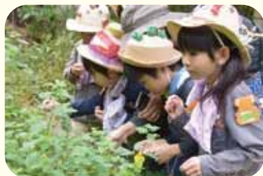
森を訪れた保育園児たち

住宅地と道路に囲まれた約 2ha の里山空間。内 80% が「特別緑地保全地区」に指定されている。屋敷林・梅林・関家の庭などからなり、散策・学習・体験・癒しの場として活用されている。屋敷林は常時開放。維持管理作業を中心に、観察会・花まつり・そうめん流しなど開催。また江戸時代から残る門や蔵の維持と、昔の生活道具や古文書の調査活動も行い、エコミュージアムとしての整備を進めている。