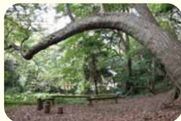
屋敷林には不思議な形の樹木もある