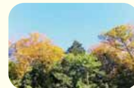
モミとケヤキの紅葉