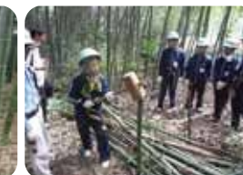
ボランティア体験